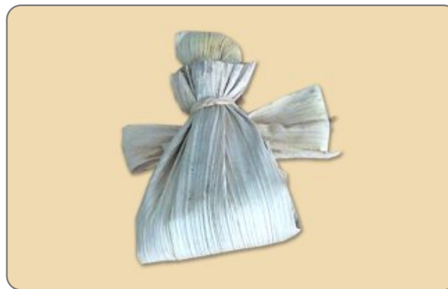
2.3. NAZIV: ANDEO - BOŽIĆNI UKRAS MATERIJAL: komušina, liko(rafija) VELIČINA: 10x6 cm