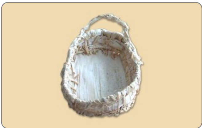
2.1. NAZIV: KOŠARICE OD KOMUŠINE - VELIKE MATERIJAL: komušina, liko(rafija) VELIČINA: 13x10 cm