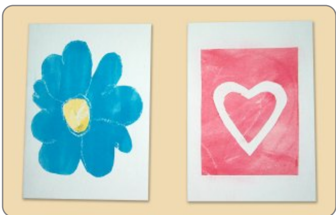
3.2. NAZIV: PRIGODNE ČESTITKE MATERIJAL: papir, svijeća, vodene boje, ljepilo, karton VELIČINA: 10,5 x 15 cm