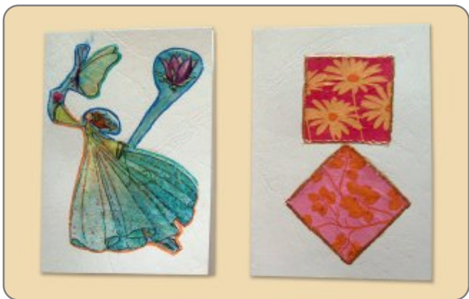
3.1. NAZIV: PRIGODNE ČESTITKE MATERIJAL: salvete, ljepilo, karton VELIČINA: 10,5 x 15 cm