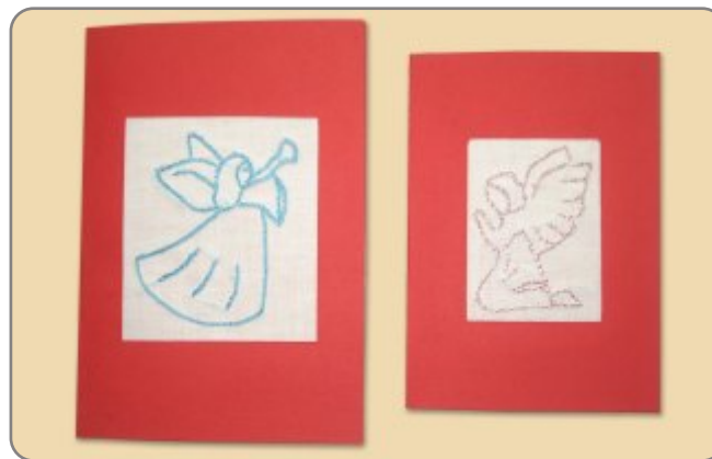
3.3. NAZIV: PRIGODNE ČESTITKE MATERIJAL: platno, konac, karton, ljepilo VELIČINA: 12,5 x 18 cm, 10,5 x 15 cm