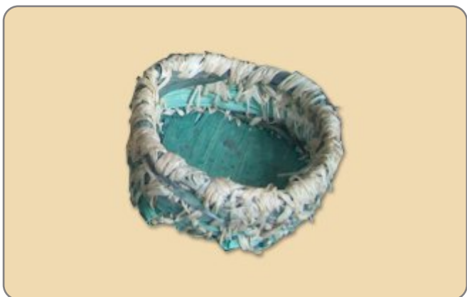
2.2. NAZIV: KOŠARICE OD KOMUŠINE - MALE MATERIJAL: komušina, liko(rafija) VELIČINA: 10x9 cm