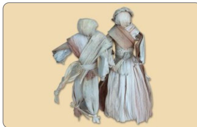
2.4. NAZIV: LUTKE OD KOMUŠINE MATERIJAL: komušina, liko(rafija), žica VELIČINA: 18x10 cm