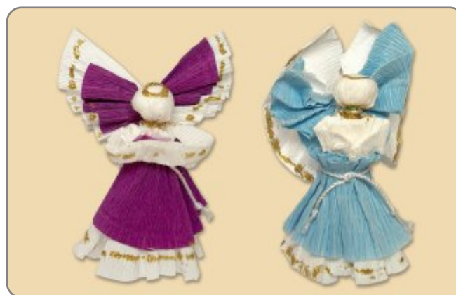
3.4. NAZIV: ANDELI MATERIJAL: krep papir, žica, ukrasi, ljepilo VELIČINA: 10 x 14 cm